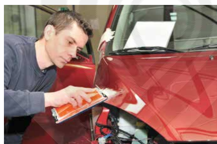
Reparación de Choques