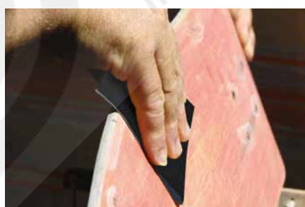
Madera y Muebles