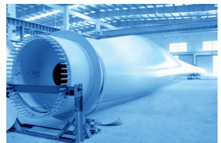
Industria de Generación Eólica