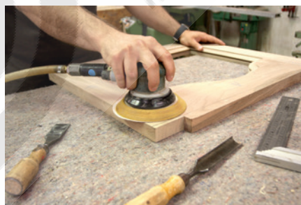
Industria de Muebles